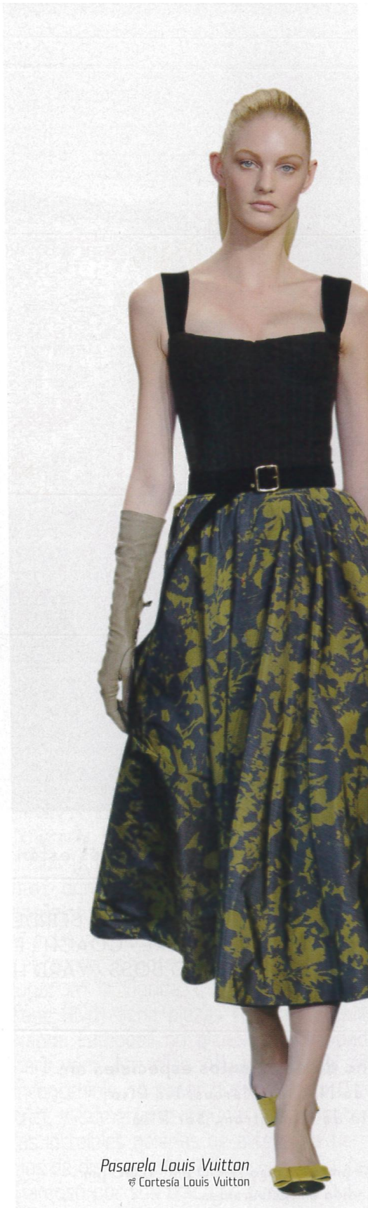
Pasarela Louis Vuitton